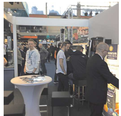
Onderschrift: Klanten proberen de nieuwe G-box uit.